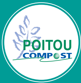
Plate-forme de compostage de Ingrandes sur Vienne (Vienne)